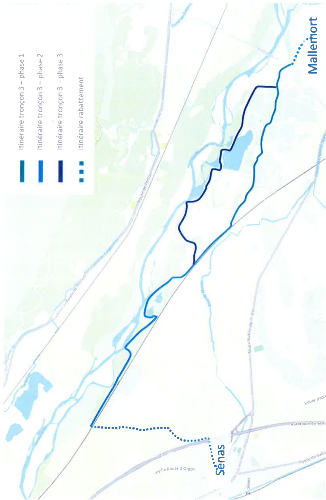
Itinéraire et phasage du tronçon 3 de la véloroute Mallemort-Sénas