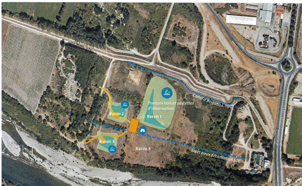
Schéma de principe de réhabilitation de la zone humide de Tarteau : création de zones ennoyées peu profondes (en jaune) et de zones plus profondes (en vert). Aménagements connexes : mise en place d'un cheminement piéton et d'une plateforme d'observation

Par ailleurs, il est prévu d'organiser sur le site réhabilité des cheminements piétonniers accompagnés d'un parcours d'interprétation à vocation pédagogique.